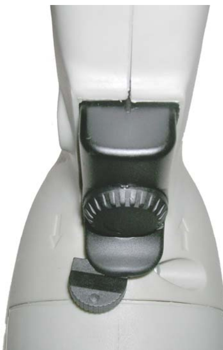
Рисунок 2. Положение переключателя направления вращения (реверс)

ВНИМАНИЕ! В целях предохранения вала гибкого с наконечниками от раскручивания переключатель направления вращения (реверс) на машине (см. паспорт 24.01.03.00.00 раздел 4) должен быть перевернут в положение, задающее вращение шпинделя в правую сторону (по часовой стрелке), смотрите рисунок 2.